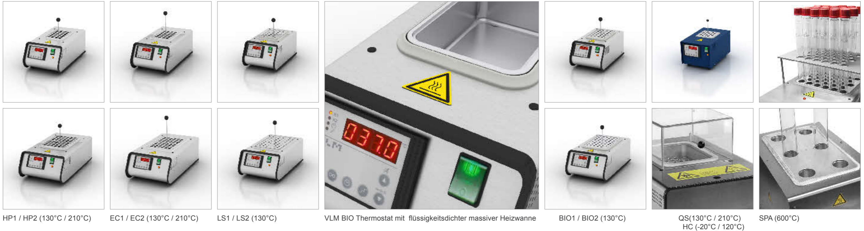
HP1 / HP2 (130°C / 210°C)

Das komplette Sortiment und die Preislisten finden Sie unter www.vlm-laborshop.de